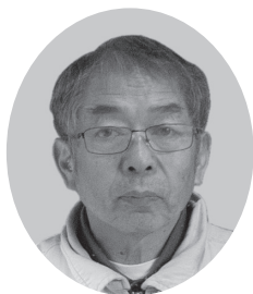
阿 部 憲 政